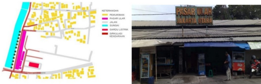
Gambar 5. Pasar Ular

Berikut eksternalitas sirkulasi, ruang berkumpul, kebisingan, view, dan lansekap yang terjadi dari Pasar Ular yang dirasakan pihak ketiga yaitu warga sekitar Rawa Badak.