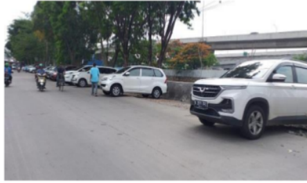
Gambar 6. Parkir Liar Di Pasar Ular

Keberadaan pasar ular menciptakan ruang-ruang berkumpul baru bagi pedagang itu sendiri maupun warga sekitar. Ruang-ruang berkumpul warga berada disekitar belakang pasar ular yang berbatasan dengan permukiman warga.