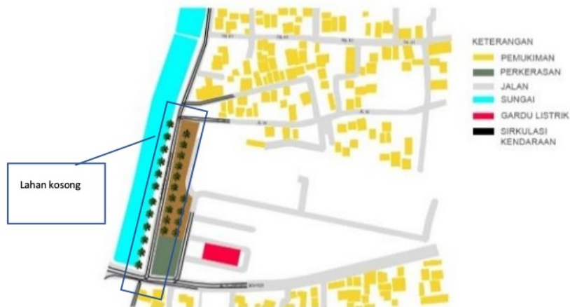
Gambar 3. Kebisingan

Fasilitas-fasilitas untuk berkumpul dan bersosialisasi terjadi pada ruang-ruang kondisional yang ada. Dan tidak banyak terjadi di jalan utama (jl. Inspeksi kali sunter) karena relatif sepi.