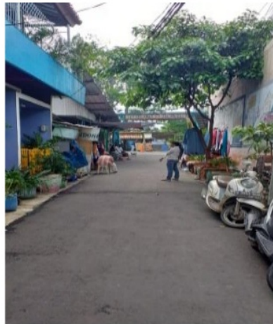
Gambar 4. View permukiman ke arah sungai

View yang dapat dilihat dari permukiman ke arah sungai tidak terhalang, otomatis hanya beberapa bangunan semi permanen yang terbangun liar disana.