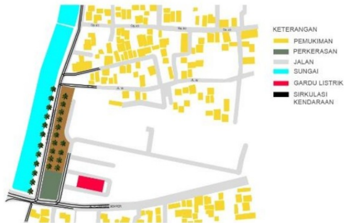
Gambar 1. Kondisi sebelum adanya Pasar Ular tahun 2000

Keberadaan Pasar Ular yang tumbuh ditengah-tengah permukiman warga Rawabadak menghasilkan eksternalitas ruang pada sirkulasi, ruang berkumpul, kebisingan, view, dan lansekap yang tergambar dari keadaan sebelum adanya pasar dan sesudah adanya pasar. Berikut akan dijelaskan keadaan sebelum adanya pasar, yang didapat dari kajian literatur, pantauan Google Earth , dan wawancara.